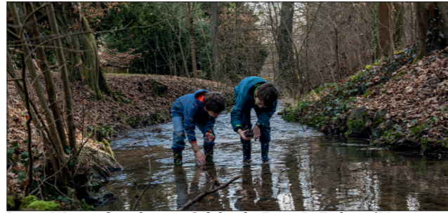
Junge Wasserforscher im Salzbach; Foto; B. Fickert/Museum Wiesbaden.