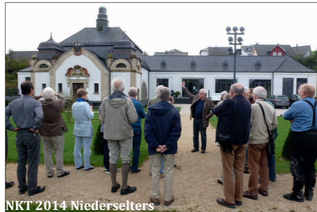
NKT 2014 Niederselters

NKT 2020 Dorfweil-Oberreifenberg NKT 2019 Villmar NKT 2018 Bad Schwalbach NKT 2017 Dorfweil NKT 2016 Wiesbaden-Fasanerie NKT 2015 Lorch a. Rh.