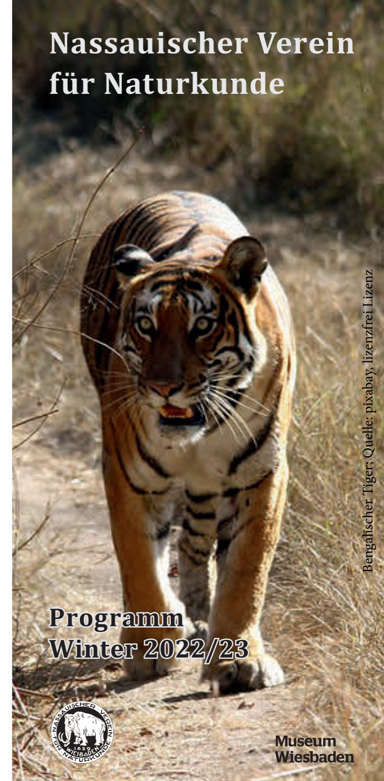
Bengalischer Tiger