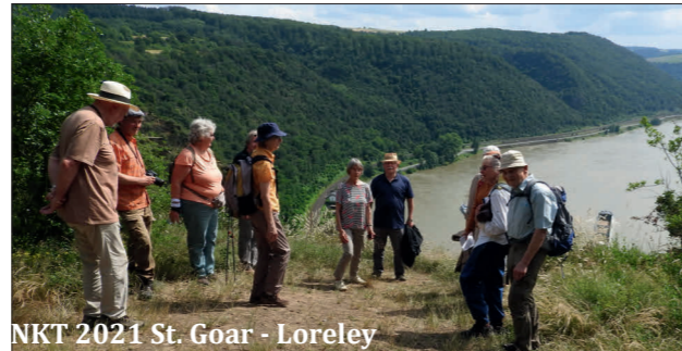
NKT 2021 St. Goar - Loreley

NKT 2020 Dorfweil-Oberreifenberg NKT 2019 Villmar NKT 2018 Bad Schwalbach NKT 2017 Dorfweil NKT 2016 Wiesbaden-Fasanerie NKT 2015 Lorch a. Rh.