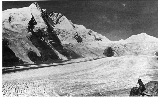
Pasterze um 1920; hist. Foto.